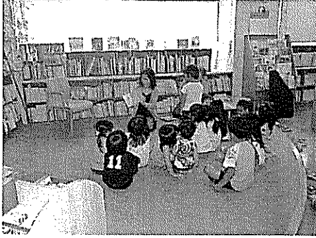
おはなし会・たなばた製作 7月 (図書室)