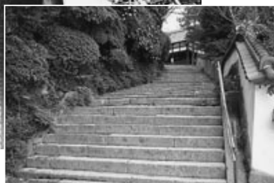
建水分神社への参道