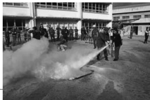
消火器による消火訓練

当日は、晴天の中多くの人でにぎわい、各種団体からの新鮮な野菜の即売やバザー、木工教室での体験コーナーなど家族連れで楽しんでいました。特に、新米の即売コーナーでは、300kgの新米が、わずか10分足らずで完売し大盛況でした。