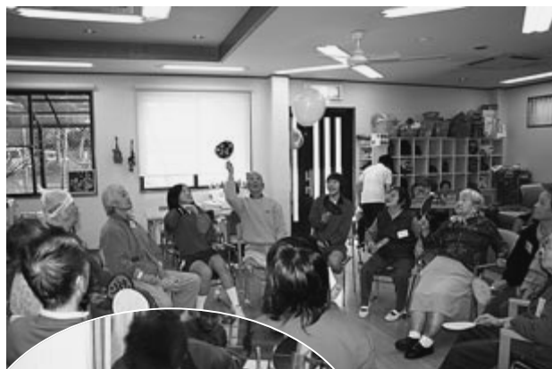
お年寄と風船遊び