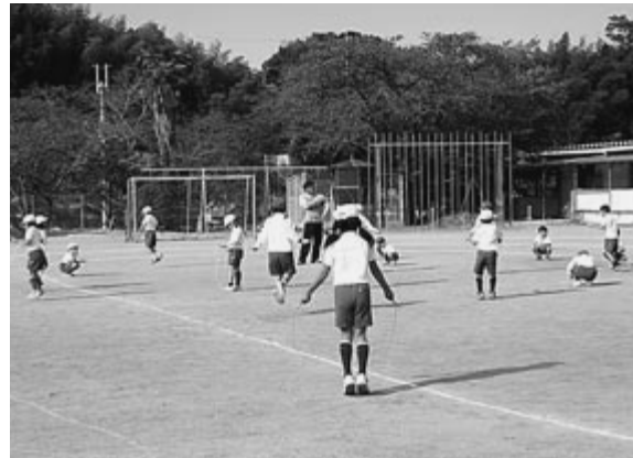
小学校での授業の様子

一方、本村においても少子化の進行は止まらず、小学校児童数が年々減少している状況です。特に平成15・16年の出生数は、それぞれ30人、29人となっており、数年後の村全体の児童が激減することが予想されます(下表参照)。 教育委員会として、このままでは、学校本来の目的である集団生活の中から切磋琢磨しながら、豊かな心を養い、学力をつけ、個性を伸ばし、生きる力を育成するという教育活動が難しい状況になると危惧しているところです。