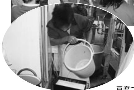
豆腐づくり体験中