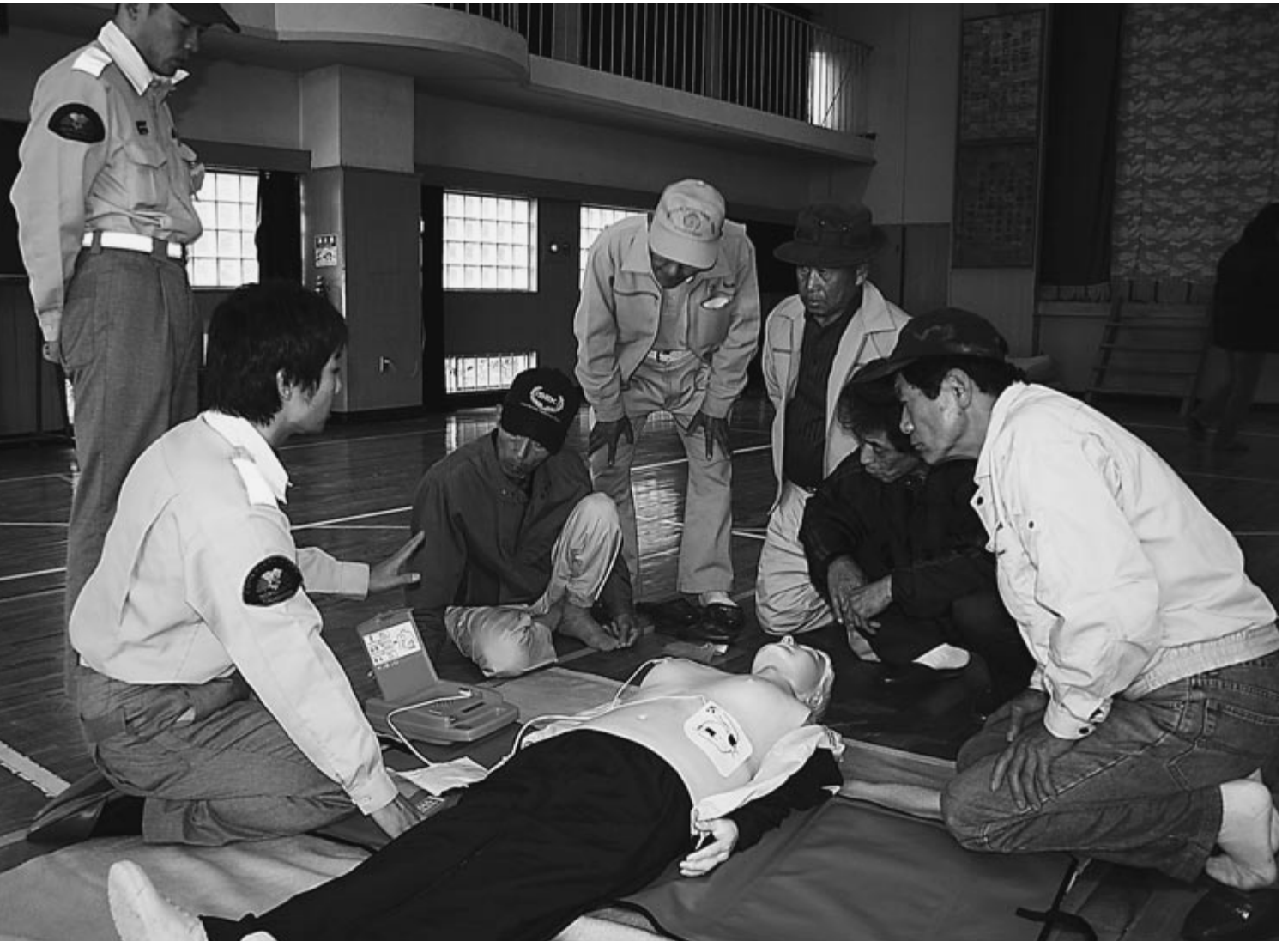
11月12日、千早小学校で救急蘇生訓練（9ページに関連記事）