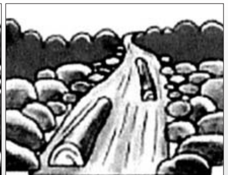
■流れが急に濁ったり、流木が混ざり始めたとき