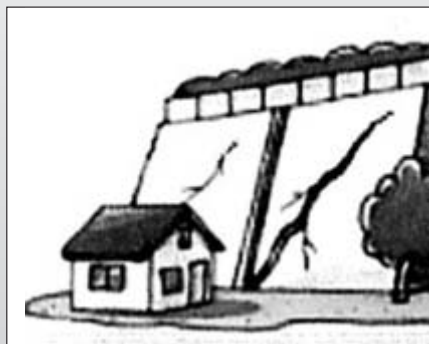
■石垣や擁壁にき裂やずれが生じたとき