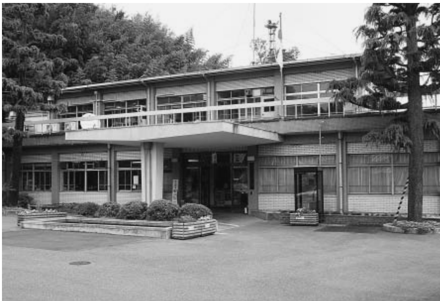
昭和38年建設の現千早赤阪村役場