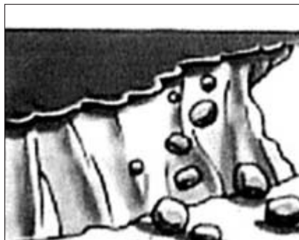
■がけが崩れだしたり、落石があるとき