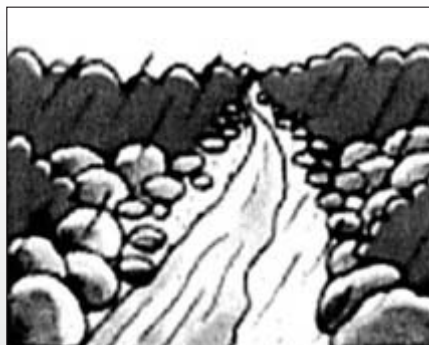
■降雨が続いているのに溪流の水位が減りだしたとき