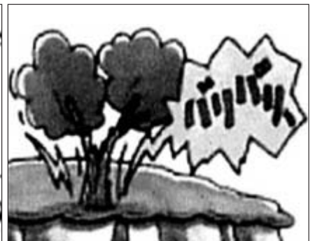
■木の裂ける音や石の流れ落ちる音がするとき