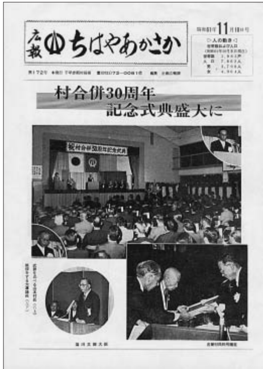
「村合併30周年記念式典」を掲載した昭和61年11月号広報

村では、この記念すべき節目の年を住民の皆さんとともに祝いし、ささやかながらでも手作りによる記念事業を検討しております。とりわけ、本年9月30日(土)に村制施行50周年記念式典を予定しております。千早赤阪村の村制50周年を思い出に残る年となりますよう、住民の皆さんのご協力・ご支援をお願いいたします。