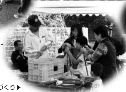
竹で水鉄砲づくり▶