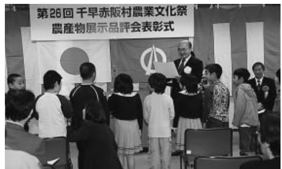
▲ かかしコンテスト表彰式