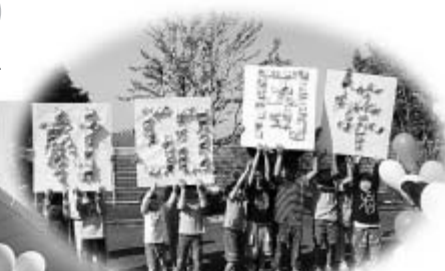
▲折り紙で絵文字 「村50周年」