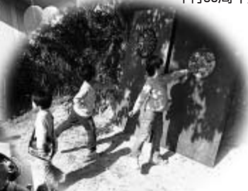
▲ウォーキング ミニゲーム (ダーツ投げ)