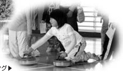
フロアカーリング▶ “真っすぐいくかな?”

11月3日、B&G海洋センターで村制施行50周年記念「村民元気フェスティバル」が行われました。