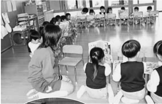
▲園児と一緒に 絵本を読む