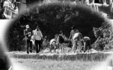
▲みんなでウォーキング