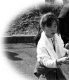
▲けん玉遊び “うまく入るかな?”