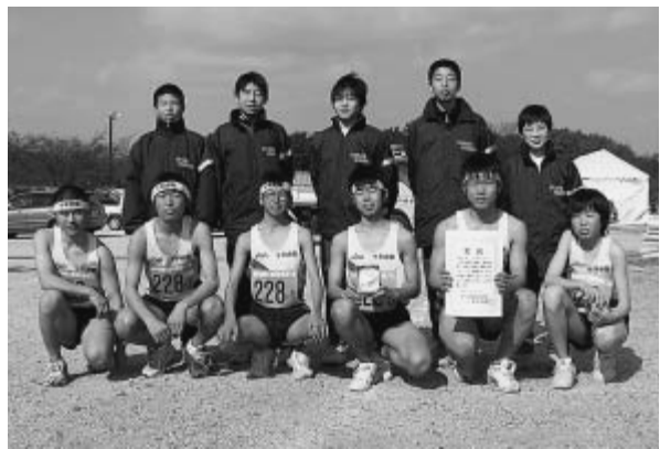
◀ 千早赤阪村立中学校陸上部