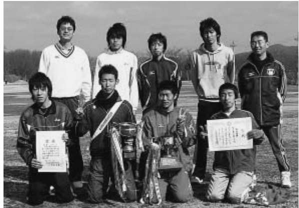
◀ 村民と愉快的仲間たち