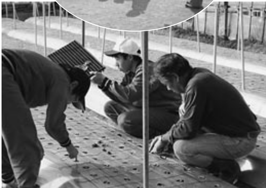
▲トルコキキョウの定植

11月15日、村の中学2年生48人がそれぞれ福祉、医療、教育、製造の各分野17カ所に分かれ労働体験をしました。