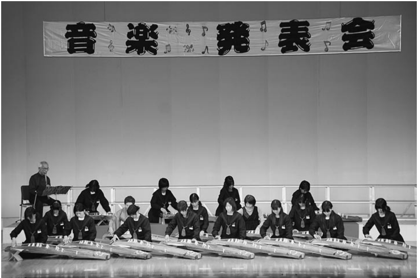
▲11月6日、音楽発表会（関連記事 12ページ）