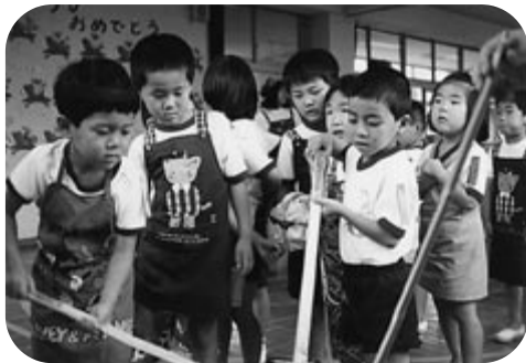
幼稚園でカレーを作った時の写真です。 (左端が私です)