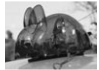
▲うさぎ型回転灯 (大阪府オリジナル)