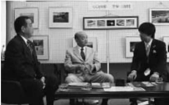
▲左から、貝長議長、松本村長、橋下知事