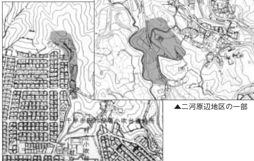
▲二河原辺地区の一部