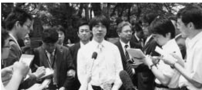
▲楠公誕生地前で記者会見

下赤阪の棚田は、大阪府が策定する「大阪ミュージアム構想」に盛り込まれる予定です。