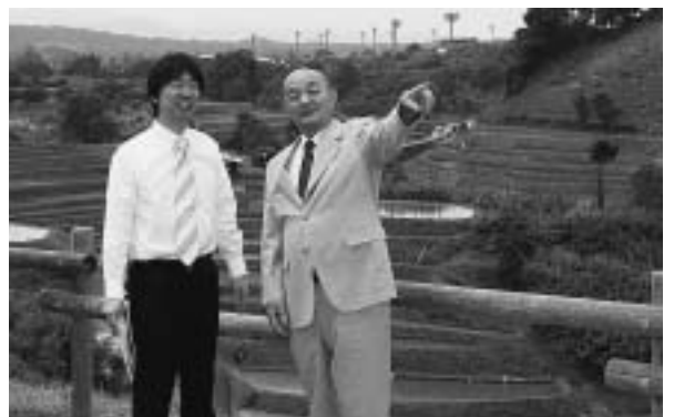
▲下赤阪の棚田を視察する

村長 「行政のスリム化をして、歳出を落とすしてきました。ところが残念なのは、国が地方交付税も削減してきました」