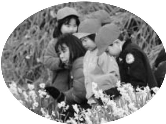
▶ここせ幼稚園児たち▶

(社)千早赤阪楠公史跡保存会が、奉建塔周辺（二河原辺地区）の景観向上のために、平成11年に植えた約5万株のスイセンが咲き、散歩する人を楽しませています。