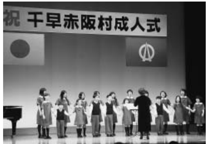
▶シープスジュニア合唱団