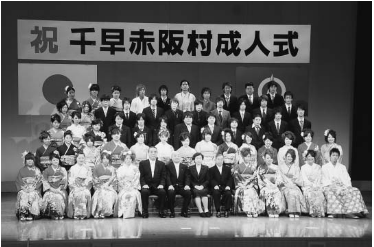
▲ 1月12日、千早赤阪村成人式 (14ページに関連記事)