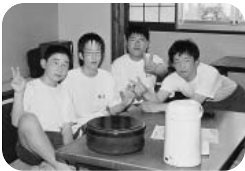
中学3年生の写真です。 おぼこいですね。(むかって左)