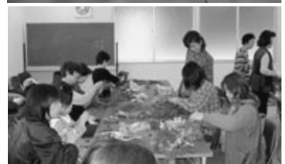
クリスマスのリース作り