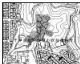
（図：小吹地区の一部）