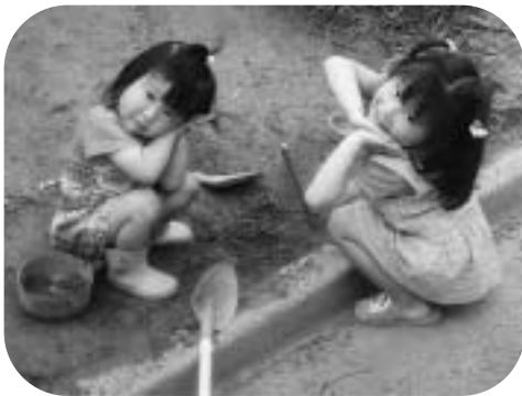
2歳のとき、お姉ちゃんと砂遊びをしているところです。(写真左)