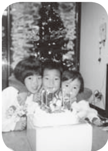
5歳の時のクリスマス の写真です。 (一番左が私 です)