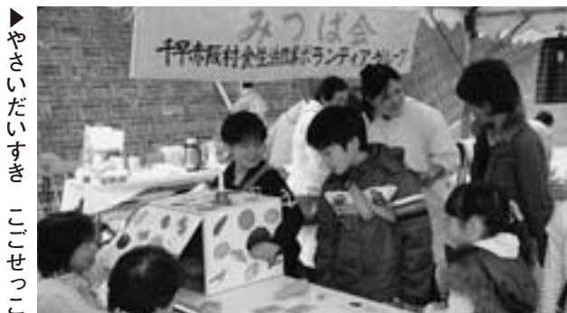
▶やさいだいすきごせっこ

また、11月16日には中学校の土曜参観にあわせて、『村野菜 食べへんか〜?』を開催しました。子どもや保護者の人に村の旬のおいしい野菜を知って、家庭でも村野菜をたくさん食べてもらうため、当日は生産者の人から採りたて野菜の販売が行われました。生産者の人から野菜の話聞くなど、交流も図られていました。保健センターからはそれらの野菜を使用したレシピの配布を行うなど、家庭での食育の大切さについてPRを行いました。