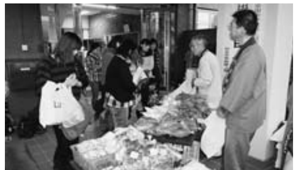
◀村野菜 食べへんか〜?