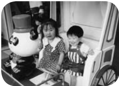
姉と遊園地へ遊びに行ったときの写真です。右側が僕です。