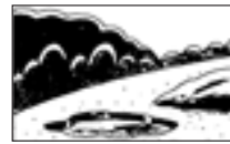
■地面が急に盛り上がりたり、陥没したとき