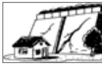
■石垣や擁壁にき裂やすれが生じたとき