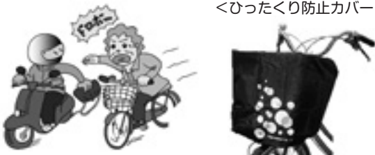
<ひったくり防止カバー>