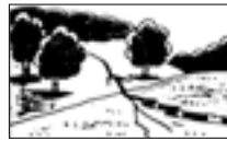
■がけや地面にひび割れができたとき