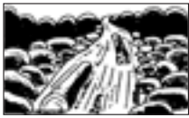
■流れが急に濁ったり、流木が混ざり始めたとき