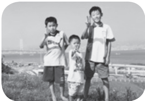
3歳か4歳のとき、淡路島で兄2人と撮った写真です。真ん中が僕です。