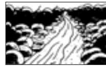
■降雨が続いているのに深流の水位が減りだしたとき