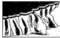
■がけから水が急に湧きだしてきたとき