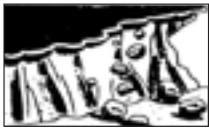
■がけが崩れたり、落石があるとき