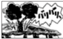
■木の裂ける音や石の流れ落ちる音がするとき