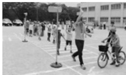
▲千早小吹台小学校