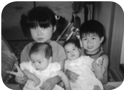
5歳のときにきょうだい4人で撮った写真です。左上が私です。