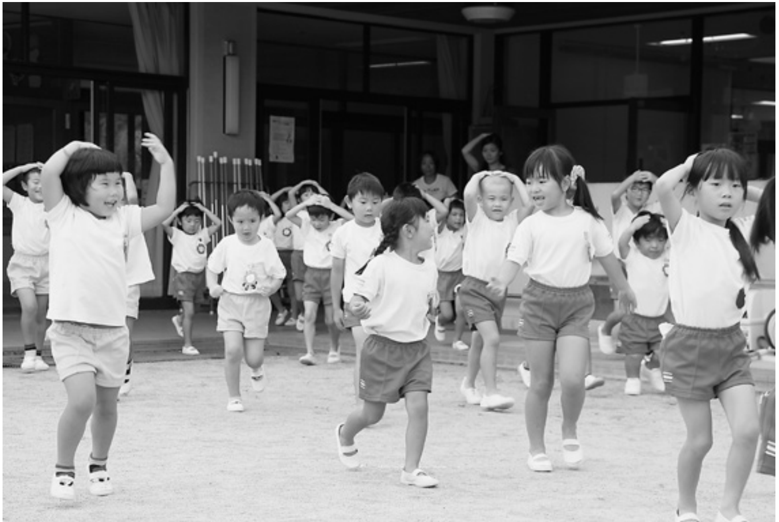
▲こごせ幼稚園での防災訓練（関連18ページ）