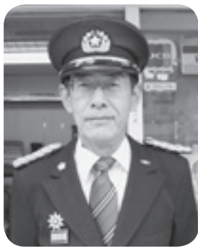
千早赤阪村消防団団長

千早赤阪村消防団では団員を募集しています。入団に関することや消防団に関することは問い合わせください。