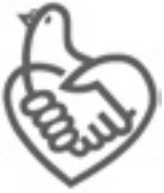
条例啓発シンボルマーク