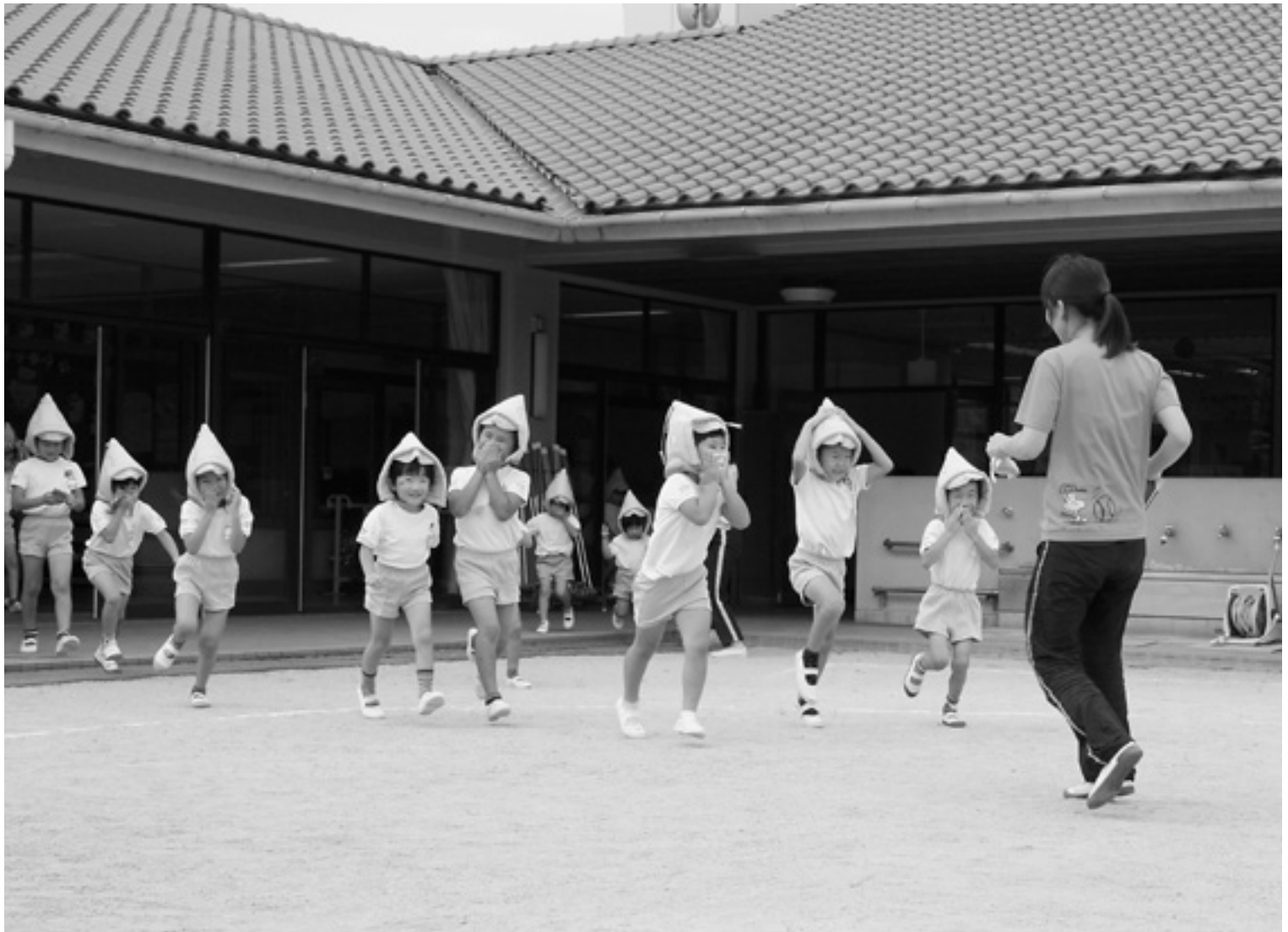
▲こぞせ幼稚園での防災訓練 (関連記事22ページ)