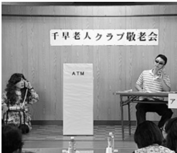
▲ 9月18日千早老人憩の家での風景

富田林警察署の駐在所の4人が特殊詐欺の手口を再現した寸劇を行い、各地区の千早赤阪村老人クラブの皆さんに対して被害に遭わないよう注意を呼びかけました。