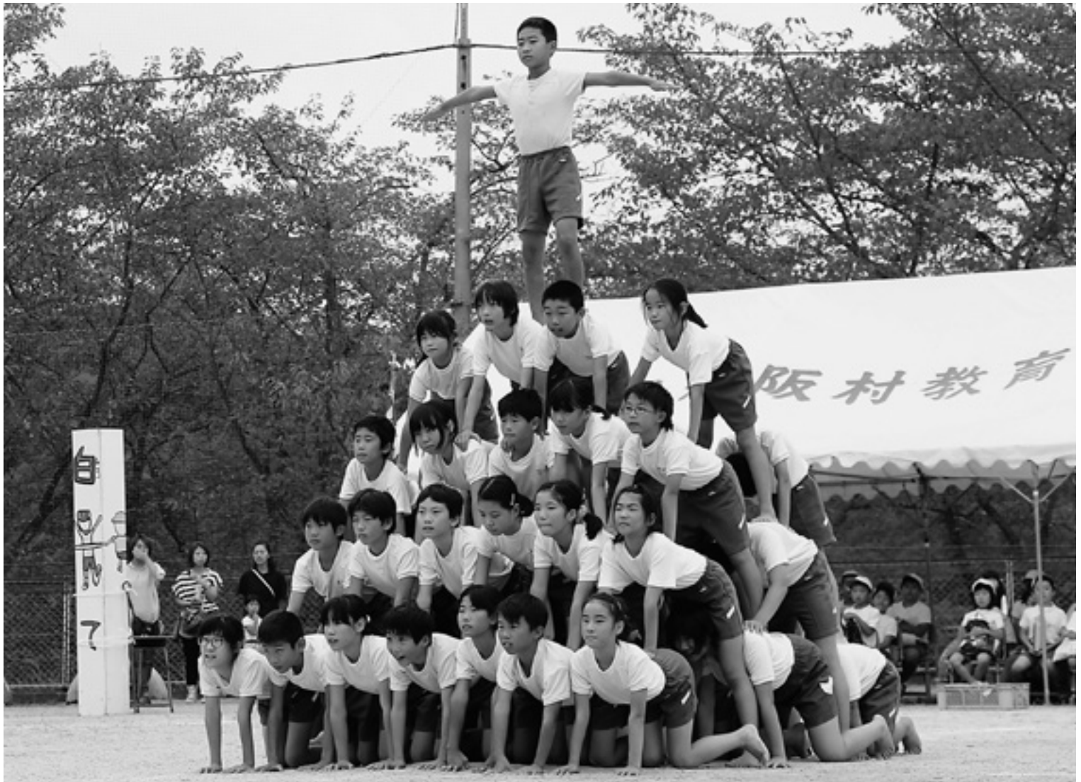
▲村内各小学校で運動会が行われました。(写真は千早小吹台小学校4・5・6年生による団体演技「Rainbow Road」。赤阪小学校は25ページに掲載。)