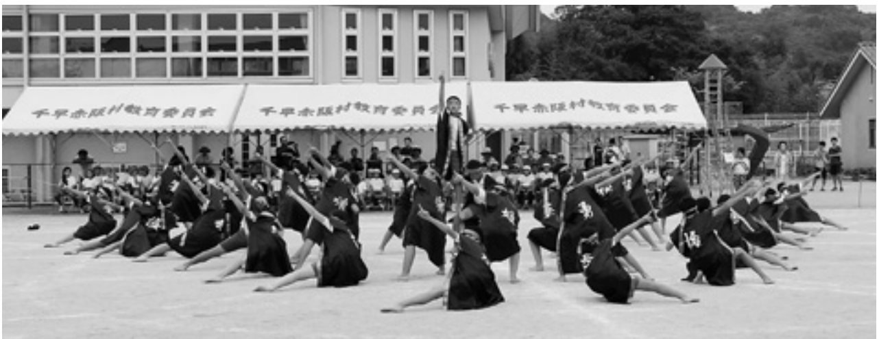
▲赤阪小学校5・6年生による団体演技「虹の架け橋～一人ひとりの想いを繋いで～」 (千早小吹台小学校の様子は表紙に掲載)