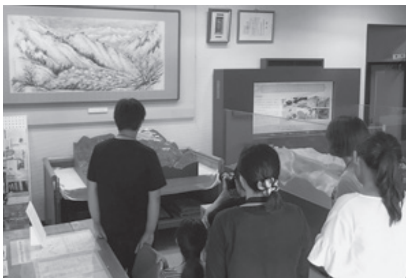
実習の様子(資料撮影実習)

教育課では、9月5日(火)から9日(土)までの5日間、阪南大学から博物館実習生6名を村立郷土資料館に受け入れました。その実習の中で、資料館の収蔵庫に眠る資料を掘り起し、常設展示しています。今後は、展示した資料の説明板の更新などを博物館講座受講生と共に順次行う予定です。新しくなった展示を見に、資料館を訪れてみてください。