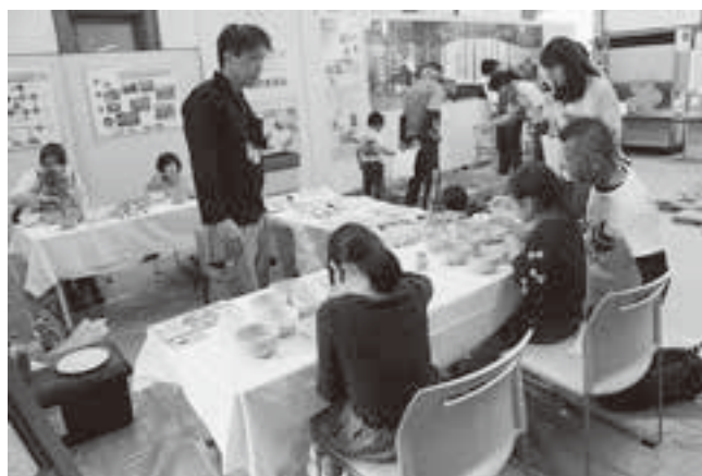
(アート教室に参加する子どもたち)