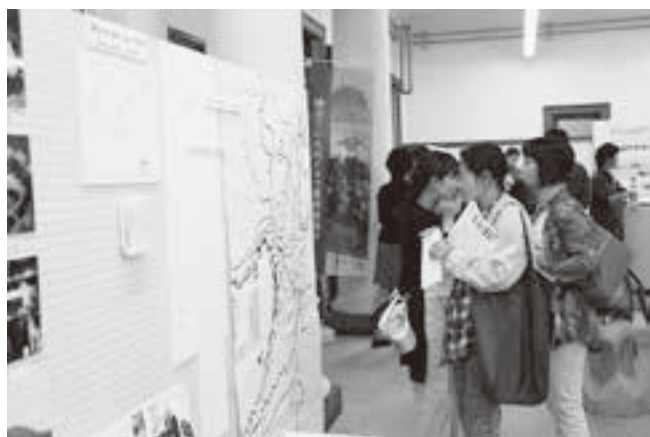
(パネルを見学する来場者)

今後も村の活性化につながるように様々な場所でPRイベントを実施し、村の魅力を発信していきます。村役場だけでなく、村内で活動する団体や住民のみなさんと一緒に村を盛り上げていきましょう。