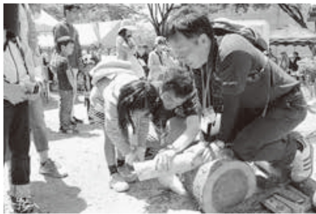
(丸太切りを体験する子どもたち)