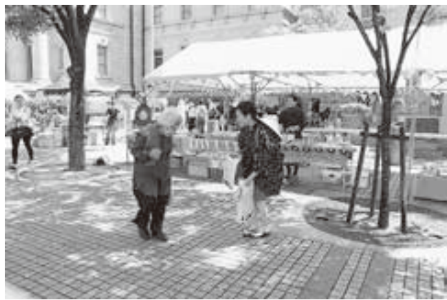
(早乙女の衣装をまとった職員がチラシ配布)