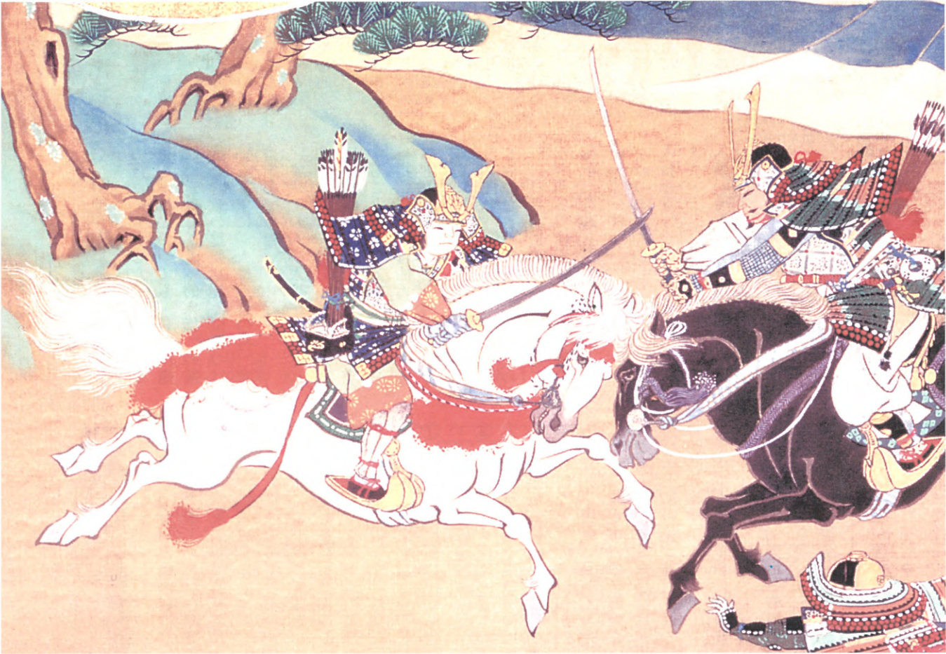
正成幼名多聞丸の初陣（部分）