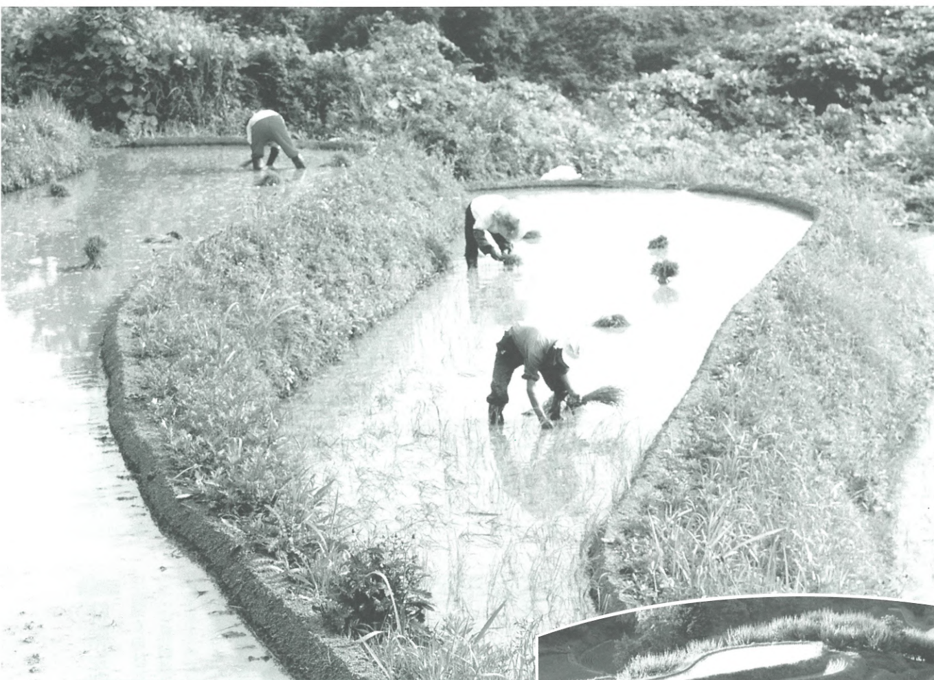
下赤阪の棚田にて