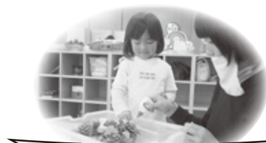
リース作りの様子

9日(水) あかちゃんランド 午前10時40分～11時 赤ちゃんを対象にした 楽しい遊びをします♪