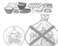
プラスチック容器包装