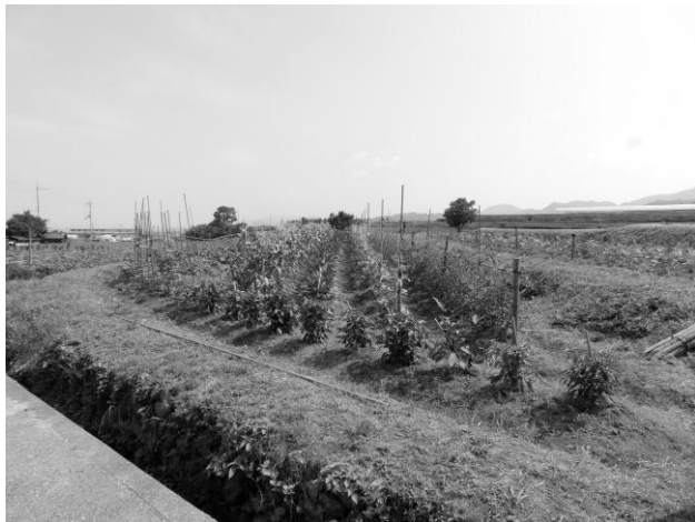
(休耕田を活用した菜園)