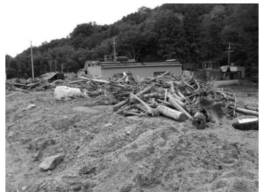
(18号台風での土砂流入した水田)

激甚の農地災害の復旧については、国の補助制度があるが、受益者負担もあり、被害を受けた農地の復旧に、村単独の補助制度の創設を検討すべきではないか。 答 農地災害の国庫補助の適用は、被災規模などの要件があり、要件を満たさない場合は、耕作者が自力で復旧している。昨年の台風18号の際、補助対象とならなかった被災の小さな農道、水路では村の原材料費補助により受益者が自力補修された例もある。個人財産である農地の小規模な災害の復旧の補助制度は考えていない。