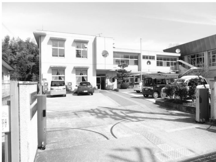
(いきいきサロンやまゆり)

問 いきいきサロンやまゆりの老朽化に対する安全性について、3月議会に引き続き伺う。