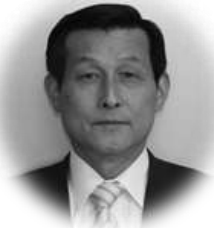
浅野 利夫 議員