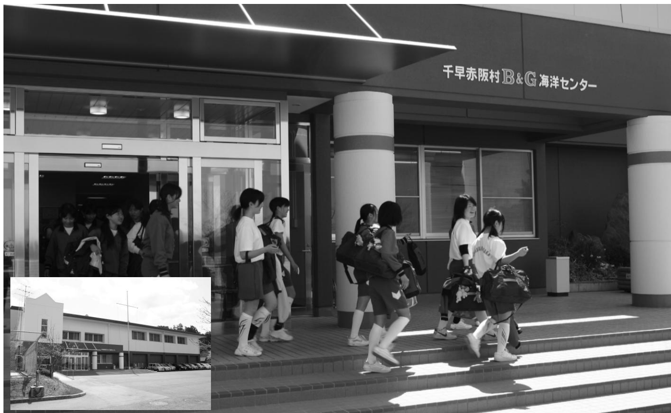
千早赤阪村 B & G 海洋センターが改修されました

大阪府南河内郡 千早赤阪村大字水分 180 番地 TEL 0721 - 72 - 0081 FAX 0721 - 72 - 1880