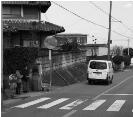
川野辺バス停付近