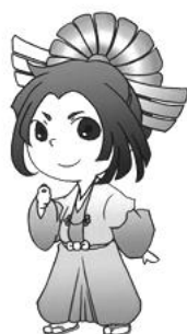
楠木正成の イメージキャラ 「まさしげくん」