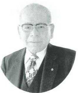
巖 溝 長 大 議

輝かしい新春を迎えるにあたり、村議会を代表いたしまして、村民の皆様にご挨拶申し上げます。昨年12月村議会において、はからずも議長の重責を負うこととなり、いままさらながら、その使命の重大さを痛感いたしました。