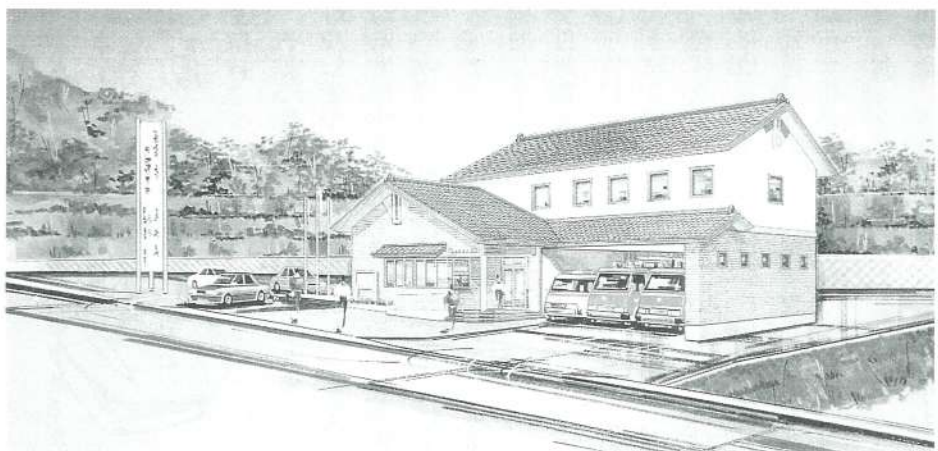
「千早赤阪分署」完成予想図

4月1日から、千早赤阪分署で消防・救急業務を開始します。また、火事と救急の通報の電話番号は119番になります。