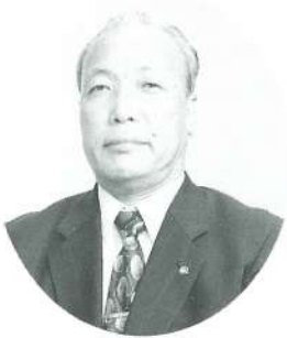
保 向 長 村 大

新年あけましておめでとうございませす。皆様にはお健やかに輝かしい新年をお迎えのことと心からお慶び申し上げます。平素は、村政全般にわたりご指導、ご協力賜り厚く御礼申し上げます。