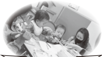
鬼の豆入れ制作の様子