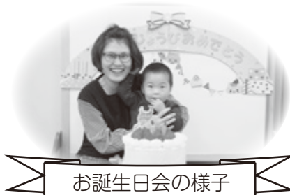
お誕生日会の様子